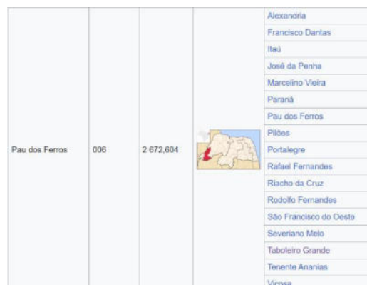
Figura 1: Microrregião de Pau dos Ferros

3.7. A participação nesta licitação é exclusiva às microempresas – ME e empresas de pequeno porte- EPP do ramo pertinente ao objeto licitado, COM PRIORIDADE DE CONTRATAÇÃO ATÉ O LIMITE DE 10% DO MELHOR PREÇO VÁLIDO as MPES sediadas no limite geográfico do Município de Portalegre/RN e no limite geográfico da microrregião de Pau dos Ferros na forma dos dispositivos legais previstos na sessão I do capítulo V (acesso aos mercados) da Lei Complementar 123/2006, especificamente o § 3º do Art. 48, e alterações da Lei Complementar 147/2014, conforme imagem a seguir: